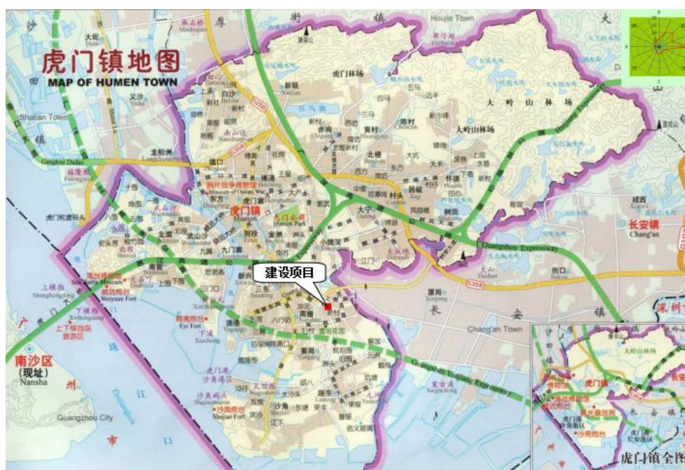
图 3-1 厂区地理位置图

东莞市勇艺达塑胶制品有限公司位于广东省东莞市虎门镇捷南路854号4栋501室(地理坐标:北纬22°47'45.96"、东经113°41'49.51"),地理位置见图3-1,厂区平面布置及监测点位图见图3-2。