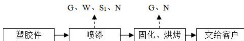
图 3-4 项目产品打样工艺及产污环节流程图